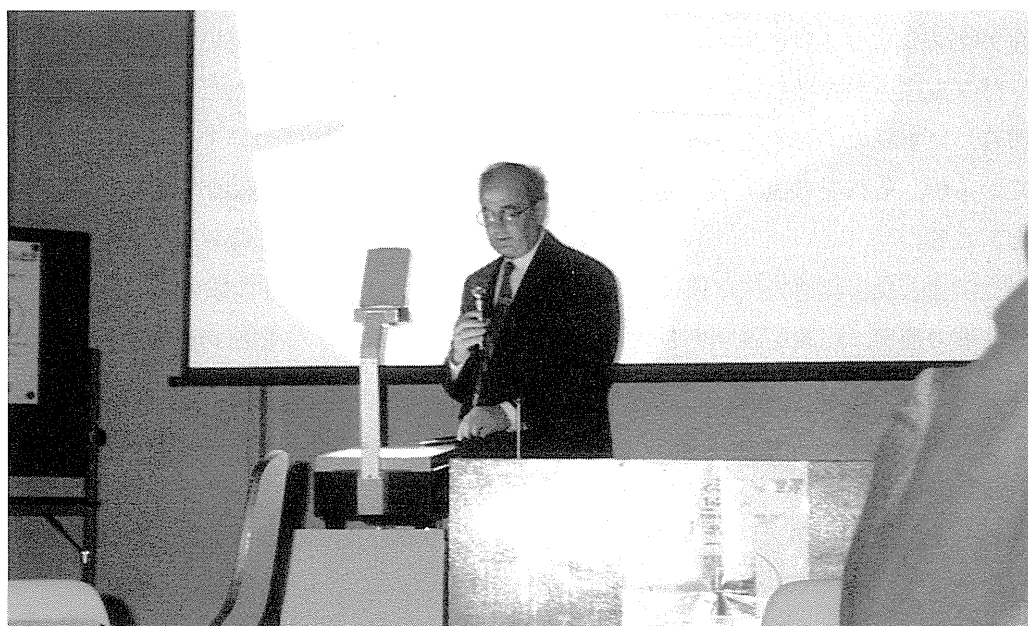
図1 LIGAの講演を行うMenz教授(独KFK)

本フォーラム最後の講演はNTTSLI研木下博雄先生による『軟X線縮小投影露光技術』であった。従来技術であるX線一括露光の壁である 0.2\mu\text{m} を克服するには本技術のような縮小光学系が不可欠であることが理論式を駆使して判りやすく説明され、またそのためにはX線光学系の進歩が必要であることが強調された。なお、放射光のライバルとして最近レーザープラズマ光源が現れて