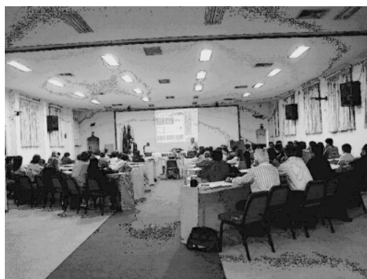
写真1 オーラルセッション会場

Time-Resolved Fluorescence Using Synchrotron